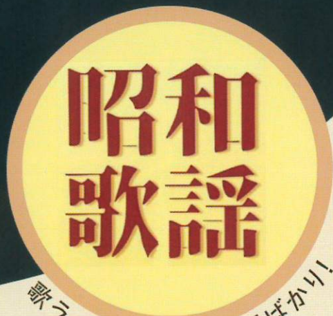
歌うのは...昭和歌謡ばかり!