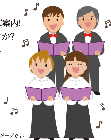
イラストはイメージです。

お一人様 平日・日曜宿泊 限定 9,900円 (税込) 〈貸切〉 ※料金には宿泊料(二食付)・練習会場・最終日のテアトロン使用料(午前中)が含まれます。 ※テアトロンを午後使用の場合、追加料金は別途お客様負担となります。 ※テアトロンのステージングをドローンで動画撮影サービス(要・事前予約/別途50,000円税込) ※雨天の場合は、お客様に実施を判断していただきます。 ※テアトロンまでの送迎も承ります。